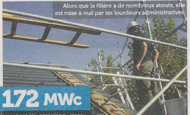
Alors que la filière a de nombreux atouts, elle est mise à mal par les lourdeurs administratives

Des incohérences graves Le système des tarifs réglementés, dans sa forme actuelle, souffre aussi de graves incohérences. Leur mécanisme d'évolution tri-