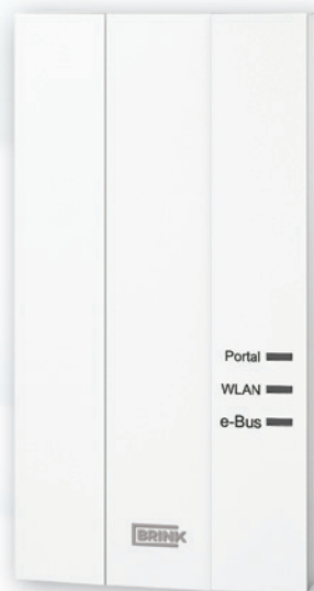
Brink Home Module

Brink Home est commercialisé depuis fin 2015. Le système de ventilation complet est alors réglable par un seul système intelligent.