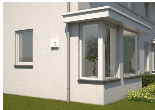
Air 70 extérieur du logement