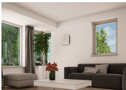
Air 70 intérieur du logement